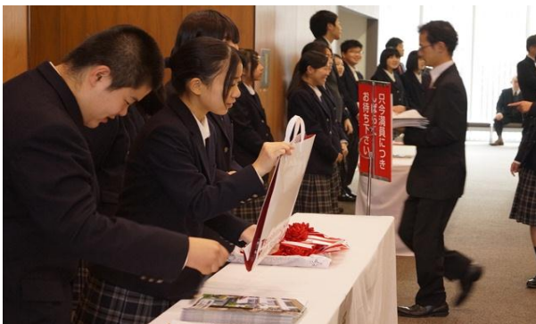
式典当日を含めた準備